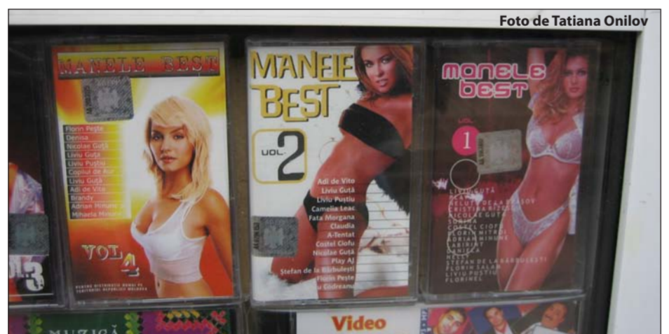
În Piața centrală manelele sunt la ele acasă.

Caracteristica cea mai răspândită a epocii noastre este faptul că omul a pierdut în propriii săi ochi, la un grad incredibil, demnitatea, iar incertitudinea, apăsările sunt proprii acestor vremuri.