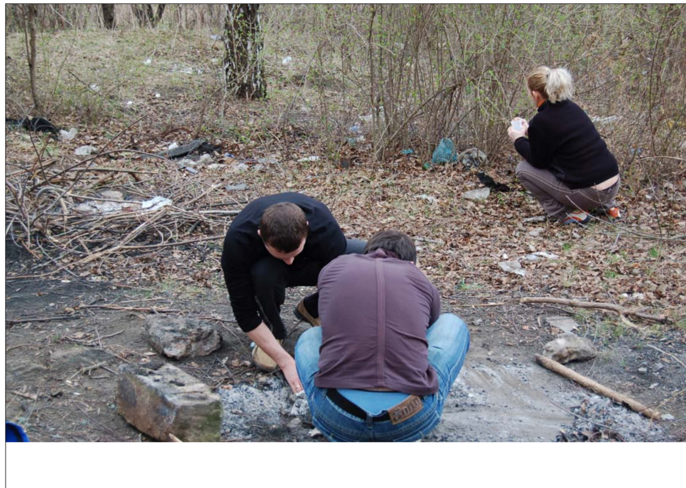
La un picnic în parcul Valea Trandafirilor