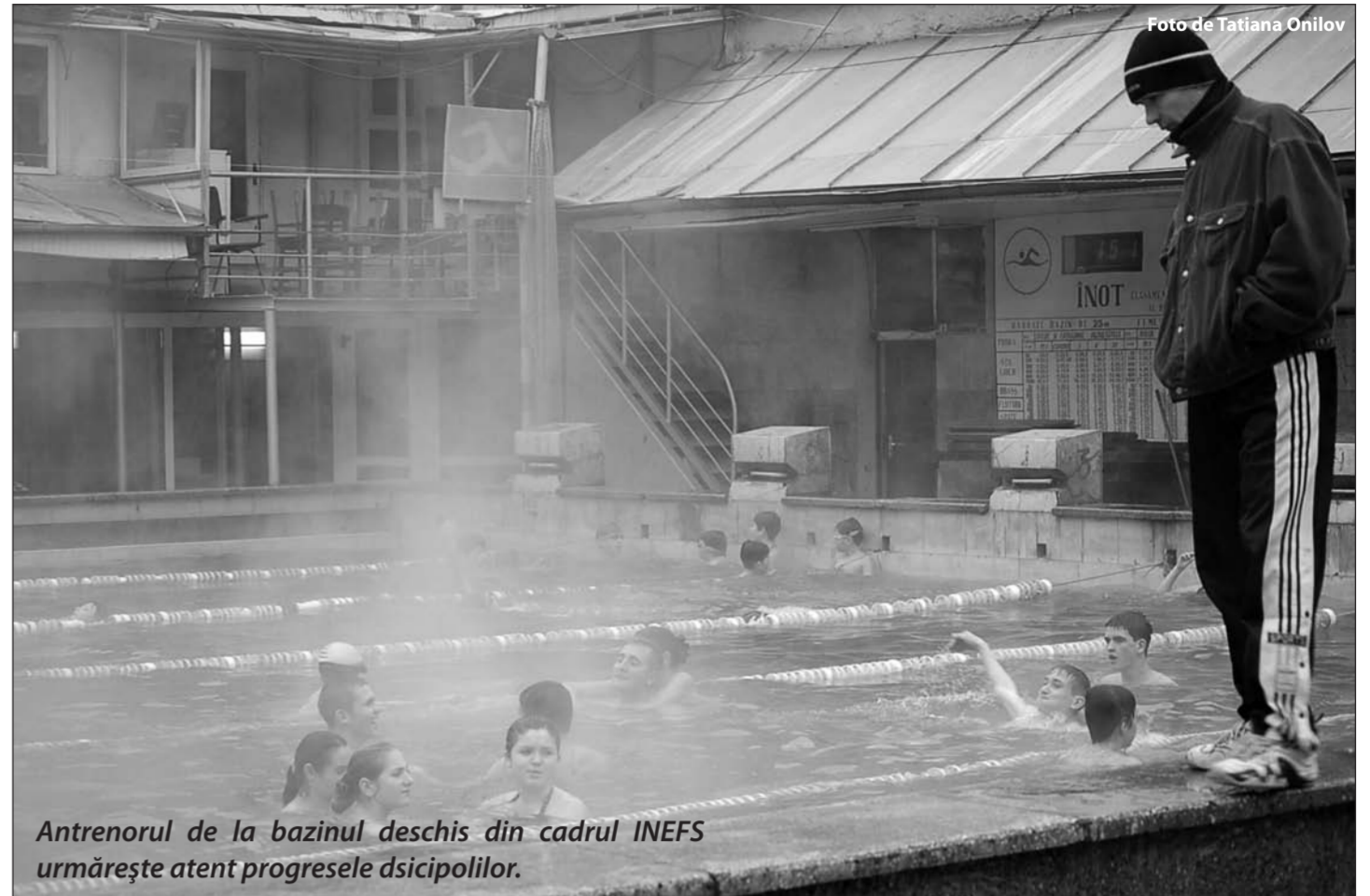
Antrenorul de la bazinul deschis din cadrul INEFS urmărește atent progresele discipolilor.